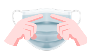
Πλαστικοποιημένο Μεταλλικό έλασμα

Μάσκες μιας χρήσης, 3ply, BFE \geq 98%. Με ελαστικά earloops και ρυθμιζόμενο επιρρίνιο έλασμα. Για χρήση από ασθενείς και άλλα άτομα για την μείωση του κινδύνου εξάπλωσης λοιμώξεων ιδιαίτερα σε καταστάσεις επιδημίας ή πανδημίας. Μάσκα Τύπου IIR σύμφωνα με το EN 14683:2019+AC:2019